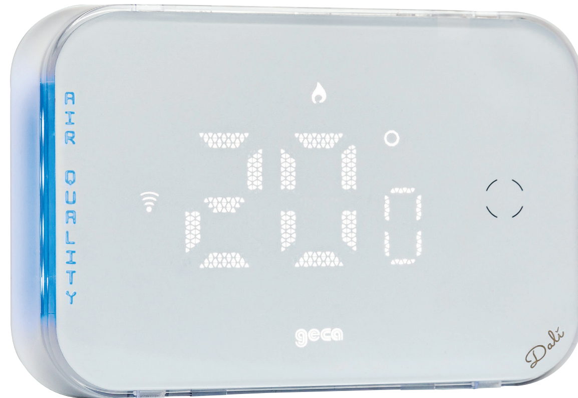
Dali 310 cod. 33102671 INCASSO