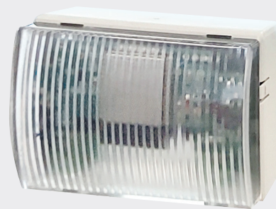
RELÈ 850 cod. 38502623

L'attuatore remoto Wi-Fi è un relè associabile senza fili ai cronotermostati Dali, ai rivelatori di anidride carbonica YUKON 860 e ai monitor di qualità dell'aria da tavolo YUKON. Consente l'attivazione di eventuali purificatori d'aria, deumidificatori, sistemi di ventilazione, ecc.